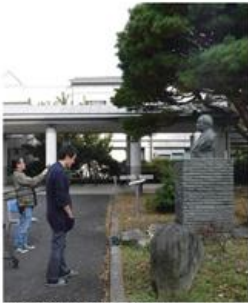
松沢病院の呉秀三胸像

呉秀三（くれしゅうそう）は、今から百年前の時代に東京大学医学部精神科の教授として、異例の社会的な取組みを進達者先である。彼は精神疾患の人々が「座敷牢」に押し込まれる実情を憂い、その解決のために奔走した。その土台となった報告書『精神病患者私宅監置ノ実況及び其統計的観察』を1918年に提起し、多方面へ働きかけた。それから1世紀の年月が過ぎた今、精神障害者の問題はどうか？ 精神障害者をめぐる問題は一つの国の在り方を左右する重大なものであり、欧米でも改革が進められている。何故なら、