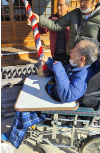
(文責 上村 健太)

お参り後は、近くの夢庵に寄りランチ外食をしました。デザートまで満喫して、2026年最初の外出を楽しみました。寮でもオリジナルの絵馬を用意して、それぞれの願いを掲げています。皆さんもエタンセールへ来られた際にはぜひ！